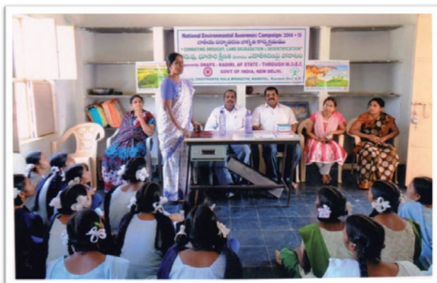
Campagne d'information de Chaitanya Kala Bharathi (CGK)