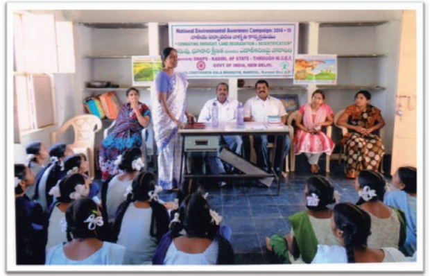
Campagne d'information de Chaithanya Kala Bharathi (CGK)

Si vous préférez recevoir notre bulletin par mail, merci de nous communiquer votre adresse e-mail (nous épargnerons ainsi des frais d'impression et des frais de port).