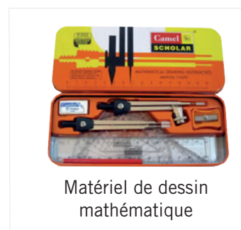
Matériel de dessin mathématique

Le matériel ci-contre est très important pour les enfants car leurs parents empêchent les filles d'acquérir l'enseignement supérieur au motif qu'ils ne peuvent pas se permettre d'acheter ces fournitures scolaires. Par conséquent, en fournissant ce matériel, nous enlevons le fardeau financier de ces familles, leur permettant ainsi d'envoyer leurs filles dans les écoles et les collèges.